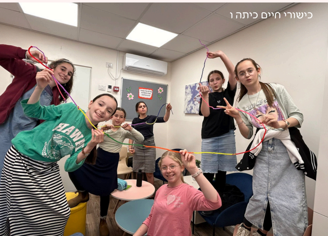
כישורי חיים כיתה ו