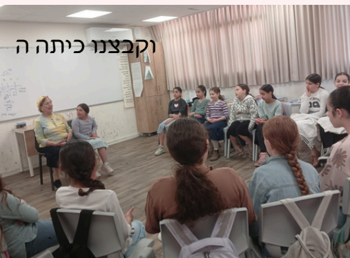
וקבצנו כיתה ה