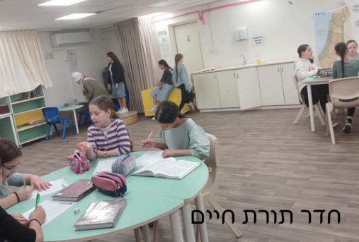
חדר תורת חיים