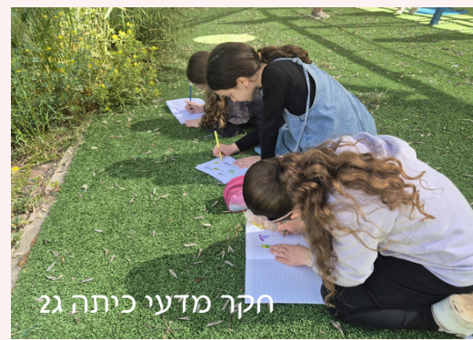
חקר מדעי כיתה ג