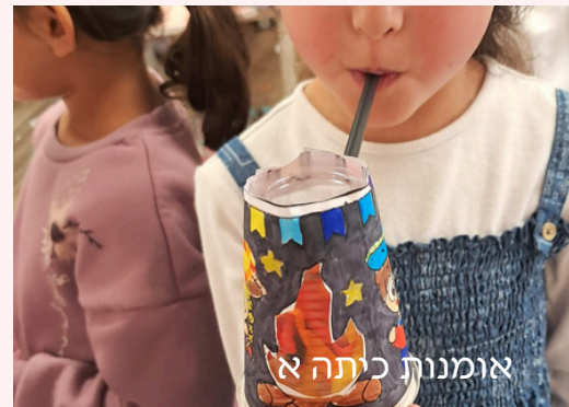
אומנות, כיתה א