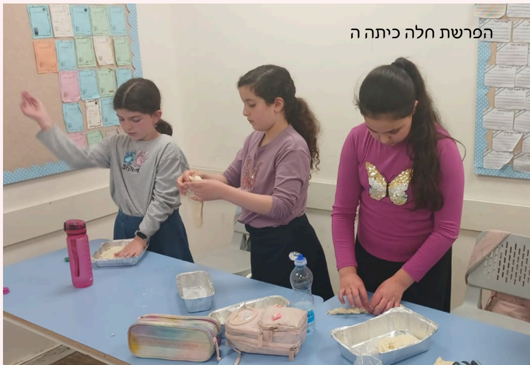
הפרשת חלה כיתה ה