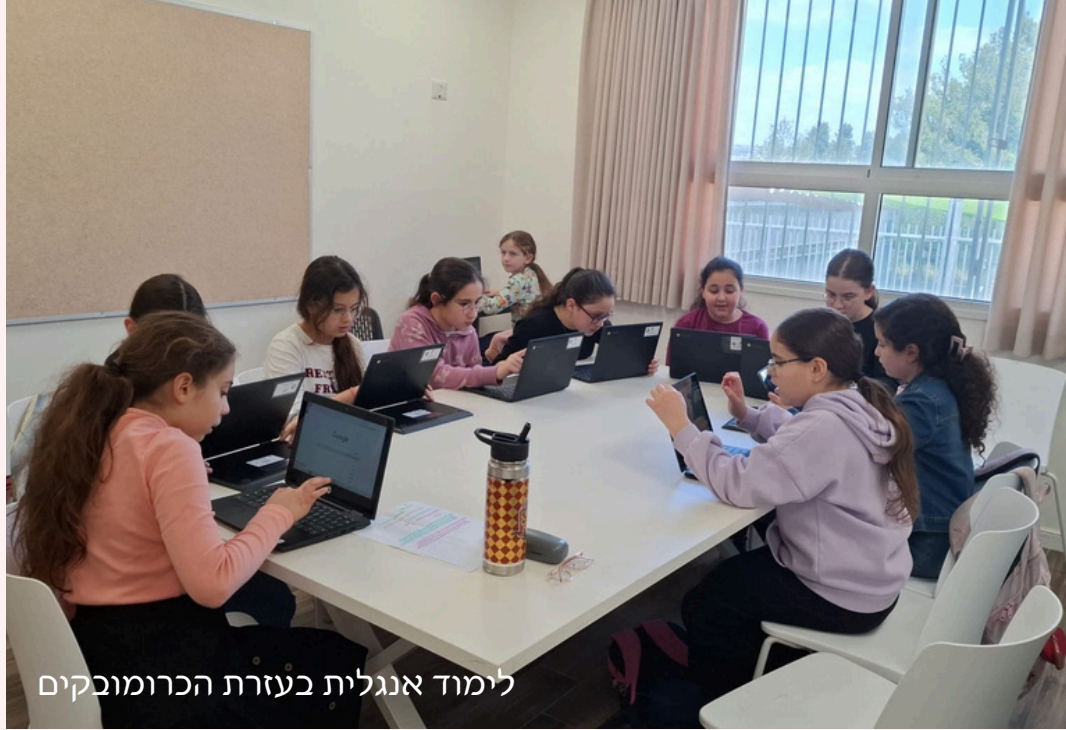
לימוד אנגלית בעזרת הכרומובקים